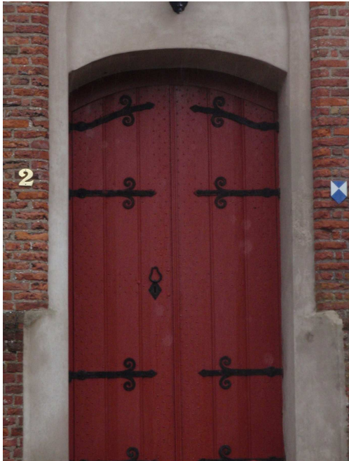
(30 pnt) Kerkpad, Muiderberg

Waar vind je de volgende deuren? Geef plaats + straatnaam!