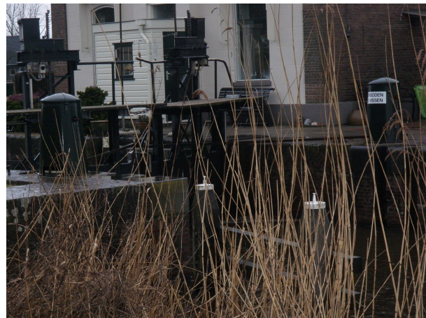
(30 pnt) Kreugerlaan, Weesp / Muiderberg