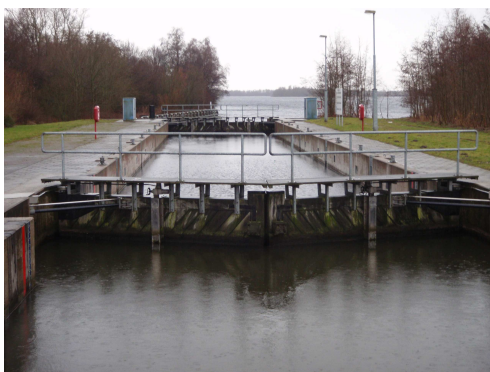
(30 pnt) Dammerweg, Nederhorst